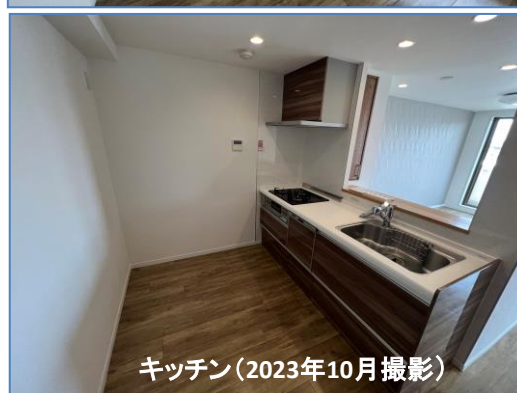
キッチン(2023年10月撮影)