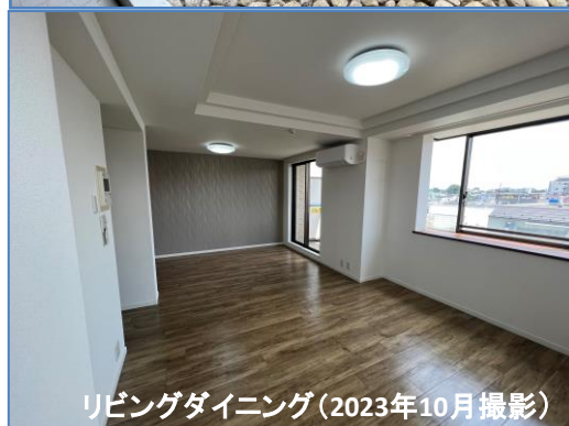
リビングダイニング(2023年10月撮影)