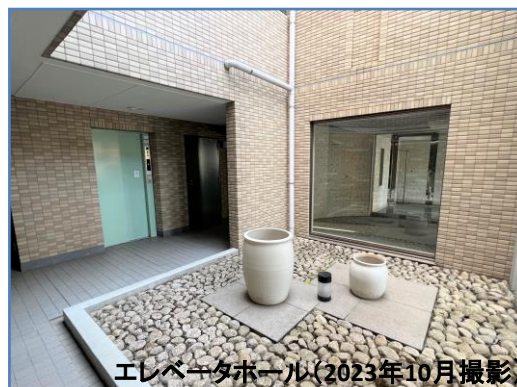
エレベータホール(2023年10月撮影)